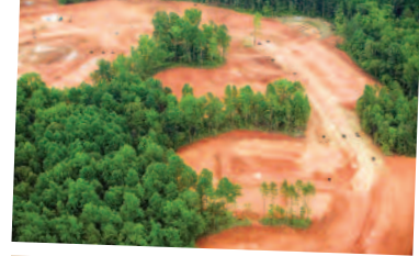
Καταστροφή φυσικού περιβάλλοντος

Πλήρης έκθεση IPBES (2016). https://doi.org/10.5281/zenodo.3402856