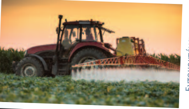
Εντομοκτόνα και Ζιζανιοκτόνα