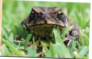
Ξενικά Εισβλητικά Είδη