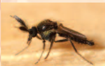
Σκνίπα Forcipomyia

Οι Ολμέκοι, οι Αζτέκοι και οι Μάγια στην Νότια και Κεντρική Αμερική πίστευαν ότι το κακάο είναι δώρο των θεών, πιο σημαντικό από το χρυσό και το χρησιμοποιούσαν σε κάθε τους γεύμα. Οι επικονιαστές των φυτών του κακάο είναι κάποιες μικρές σκνίπες που τσιμπούν.